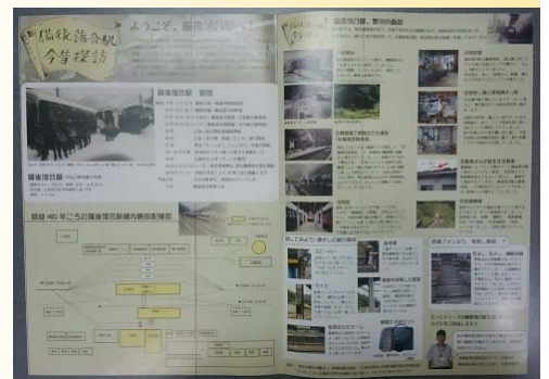
ボランティアの人から貰った資料