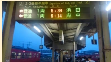
三江線の朝は早い

慌ただしく支度を済ませて、まだ窓口が営業していない三次駅の3番ホームに向かうと既に30人程の列が。この日は、今回の旅で最もタイトなスケジュールの日であり、そしてこの旅（個人的に）最大のメインイベント、三江線乗車の日でした。