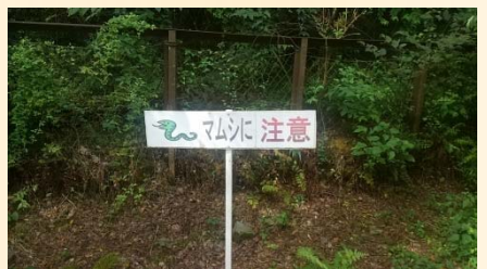
坪尻駅前の立て看板

坪尻駅は、土讃線で香川県から徳島県に入って最初の駅で、スイッチバックの駅としても有名ですが、なんといっても山の中にあり、周りに店や民家が全くなく、また駅から集落へ続く道も整備されてないため、駅周辺から出られない、文字通り秘境にある駅です。…のはずなのですが、駅で引き返す列車を待っているとバイクの音が。その方向を見ると、なんとおまわりさんが、駅の向かい側の雑草生い茂る道をバイクで走ってくるではありませんか！この時、バイクで坪尻駅まで来られる事を初めて知り、とてもびっくりしました。