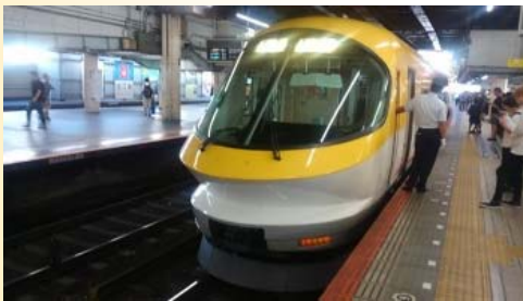
伊勢志摩ライナー

あ～・・・続きが気になります。 是非！書いて頂きたいと嘆願したところ、 ご多忙中、対応いただきました。 続編を次ページにてお楽しみ下さい(^_^)/