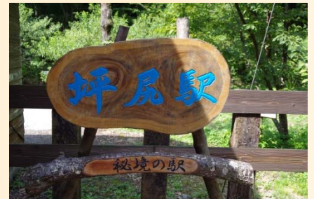
自他共に認める「秘境の駅」

乗り鉄旅行最終日。この日行きたい所は1か所のみ。香川県に住んでいた頃から何度も通り過ぎて、その度に一度は降りてみたいと思っていた駅。鉄道ファンには有名な秘境駅、坪尻駅に初めて降り立ちました。