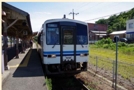
江津駅に到着した三江線

列車が入線して何とか座席を確保し、午前5時38分に三次駅を発車。車内には、立っている人を含めて約50人ほどの乗客。江津まで約4