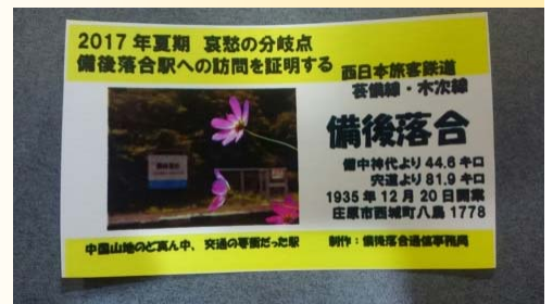
備後落合駅の訪問証明書