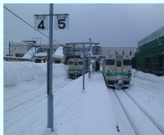
木古内駅(右側は建設中の北海道新幹線の駅)

木古内駅から1時間少々で江差駅到着。江差線沿線含めどこを見ても一面真っ白。こんなに雪に囲まれたことはこれまで無かったので、北海道の雪を満喫しながら、江差駅でも撮影に勤しみました。