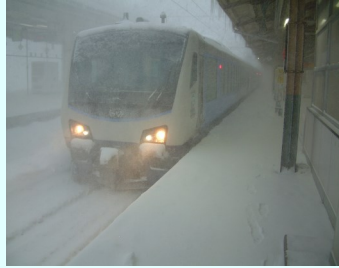
乗るはずだった 「リゾートしらかみ」

とりあえず、切符の払い戻しのためにみどりの窓口にいくと、これから北海道へ渡る人たちも長い行列となっていました。そこで聞こえてきたのが、北海道へ行くにはフェリーしかないという案内。青函トンネルが開通してから四半世紀、まさか青函航路で北海道へ渡ることになるとは思ってもみなかっただろうと思いつながら、さて自分はどうやって帰ろうか…。帰れないと青森でもう一泊しないと