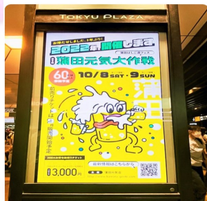
酒が酒を飲んでるの、マジで偏差値ゼロすぎて人類皆蒲田行った方がいい

10/8（土曜日）はJR蒲田駅の東口エリアで約30店舗、10/9（日曜日）は西口エリアで約30店舗が参加しており、チケットを持っている人は限定メニューが注文できるシステムになっています。